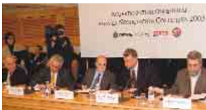
Momento de la firma del Acuerdo Interconfederal para la Negociación Colectiva 2003. (30 de enero)

• Acuerdo Interconfederal para la Negociación Colectiva 2003. CEOE, CEPYME, CC.OO.y UGT firmaron el ANC 2003. Sus objetivos fundamentales son: una política de moderado crecimiento de los salarios que permita adaptarse al contexto económico, apoyar