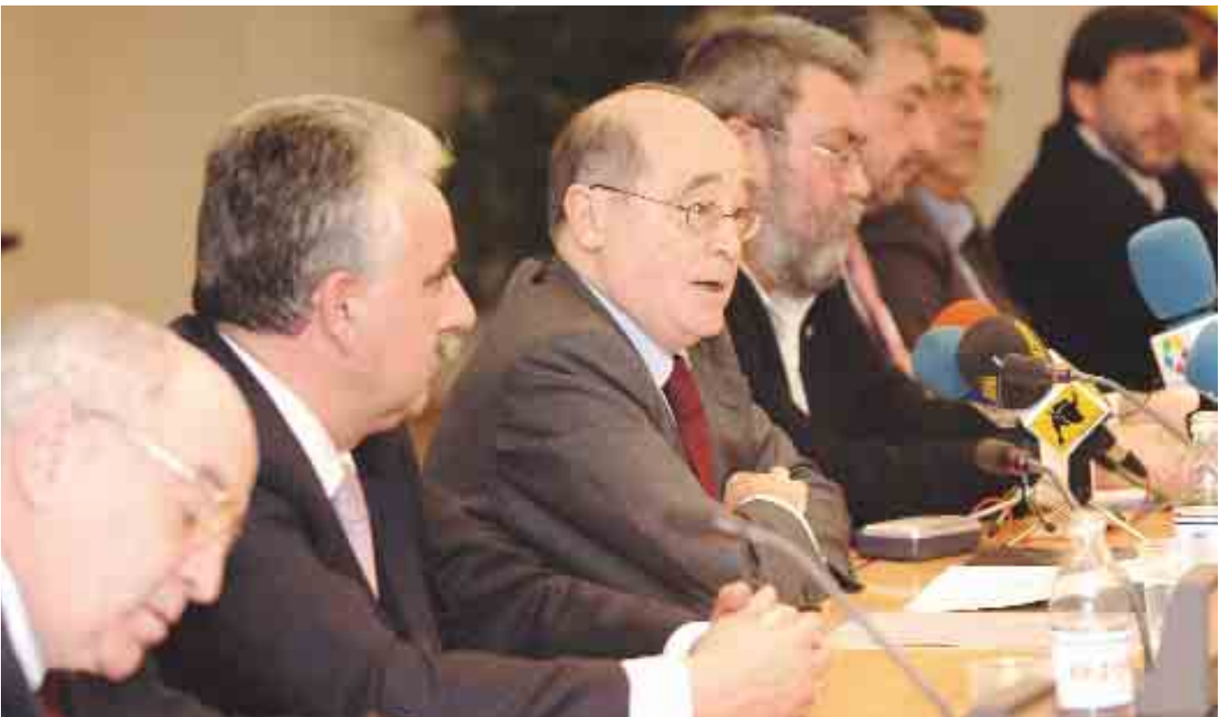
José María Cuevas expone los términos del Acuerdo Interconfederal para la Negociación Colectiva para 2004

Por ello, las Confederaciones Sindicales y Empresariales, están convencidas de la necesidad del control de la