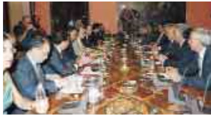
Una delegación de CEOE y CEPYME se reunió el 30 de julio con los ministros de Hacienda y de Trabajo, Cristóbal Montoro y Eduardo Zaplana.

• CEOE alerta del exceso de cotizaciones sociales. CEOE y CEPYME se reunieron con Cristóbal Montoro y Eduardo Zaplana para alertarles acerca de la sobrecotización empresarial a la Seguridad Social y transmitir la preocupación de los empresarios por las enormes cargas que han de soportar debido a los elevados costes sociales y su negativa repercusión en la competitividad de las empresas.