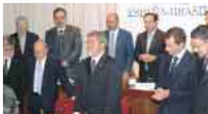
El Presidente de la República de Brasil, Luiz Inácio Lula da Silva (en el centro), momentos antes de iniciar el Encuentro Empresarial Hispano-Brasileño. (15 de julio)

• Lula, en CEOE. El Presidente de Brasil, Luiz Inácio Lula da Silva, animó a las empresas españolas a invertir en su país tras resaltar el compromiso de reformas de su Gobierno en pro de la estabilidad económica, en la clausura de un