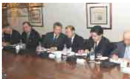
Panitchpakdi, en el centro, analiza junto con los representantes de los principales sectores económicos españoles, los resultados de la Conferencia de Cancún. (29 de octubre)

• El Director General de la Organización Mundial del Comercio, Supachai Panitchakdi, se reunió con