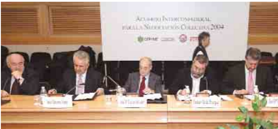
Representantes empresariales y sindicales, en la firma del Acuerdo Interconfederal para 2004

CEOE, CEPYME, CC.OO. y UGT firmaron, el 22 de diciembre, la prórroga del Acuerdo Interconfederal para la negociación colectiva para el año 2004. Sus objetivos fundamentales siguen siendo la necesidad de controlar la inflación, mantener el diseño de la política salarial antiinflacionista y el mantenimiento del empleo.