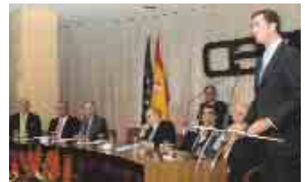
El Príncipe Felipe, en la clausura del acto conmemorativo del XXV Aniversario de la Constitución (diciembre)