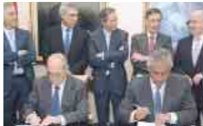
José María Cuevas y Javier Arenas firman el Protocolo para la conmemoración del 25 Aniversario de la Constitución. (28 de octubre)

• 25 Aniversario de la Constitución. CEOE firma con el Gobierno un Protocolo para Conmemorar el 25