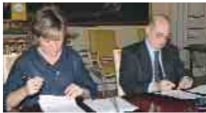
Pilar del Castillo y José María Cuevas firman el Convenio-Marco de Colaboración para el desarrollo de acciones en materia de formación profesional. (22 de abril)

• CEOE y Educación firman un Convenio. La Ministra de Educación, Pilar del Castillo y el Presidente de CEOE, José María Cuevas, firmaron un Convenio-Marco de colaboración para el desarrollo de acciones en materia de formación profesional.