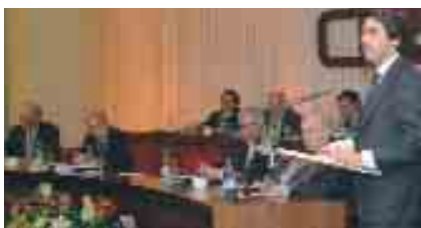
Un momento de la intervención de José María Aznar ante la Junta Directiva de CEOE. (8 de octubre)

• Aznar, ante la Junta Directiva de CEOE. Los empresarios reiteran su inalterable compromiso con España y su Constitución.