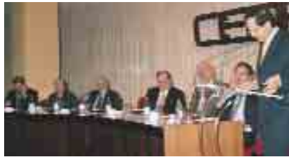
El Presidente del Senado, Juan José Lucas, en un momento de su intervención en la entrega de Premios de la Fundación CEOE. (Marzo)

• Premios Fundación CEOE. El Presidente del Senado, Juan José Lucas, afirmó que con iniciativas orientadas a "crear y promocionar unos premios que sirven para reconocer públicamente una vidas dedicadas a la creación cultural, artística y al estudio de la investigación científica, CEOE y todas las empresas patrocinadoras dan un magnifi-