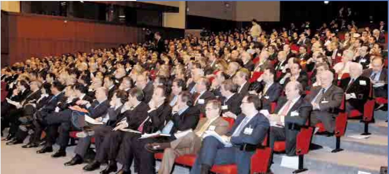
Más de 300 empresarios españoles y portugueses asistieron al Encuentro Empresarial Luso-Español.

Además de asumir una estrategia común, es necesario desarrollar proyectos y acciones concretas e innovadoras. Para ello, se deben desarrollar mecanismos de acompañamiento que faciliten la acción de las