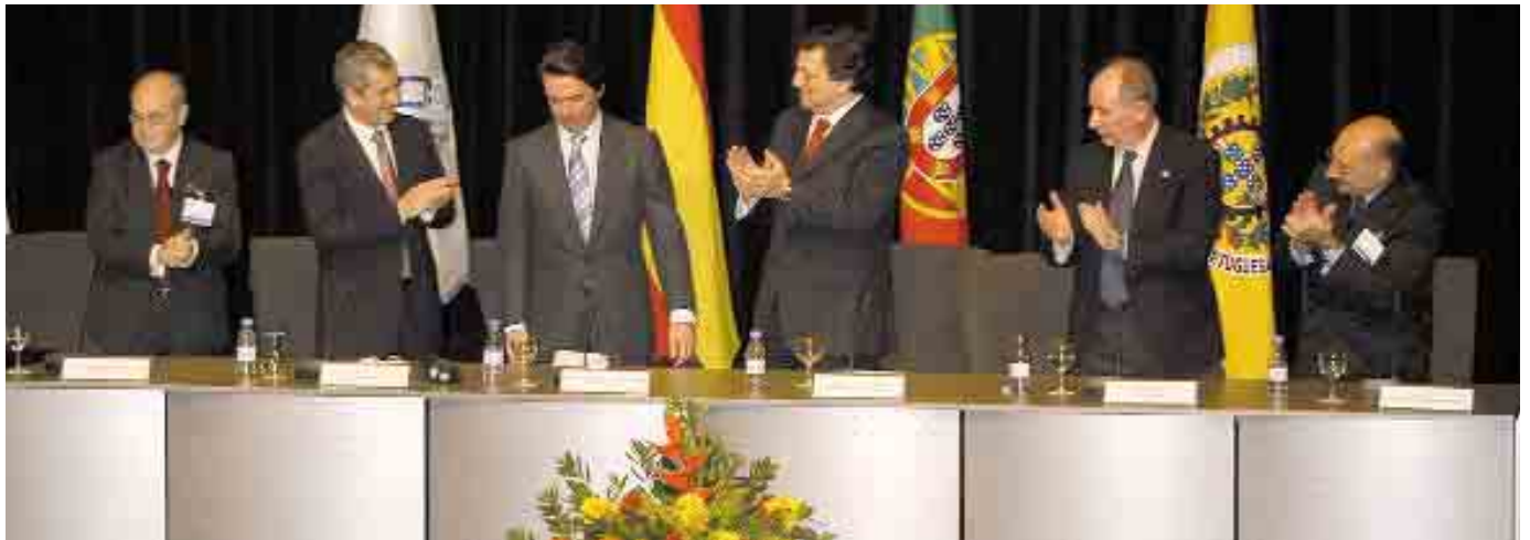
Un momento del Encuentro Empresarial luso-español, presidido por José María Aznar y el Primer Ministro Portugués, Joao M. Durao Barroso.

ENCUENTRO EMPRESARIAL LUSO-ESPAÑOL, EN LISBOA.