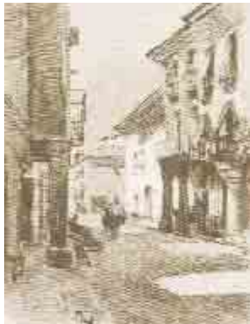
Joseph Pennell: Calle Mayor. Alcalá. c. 1903. Carboncillo al óleo y tiza blanca.

ANTE EL IV CENTENARIO DE LA PUBLICACIÓN DE LA PRIMERA PARTE DEL QUIJOTE (1605-2005)