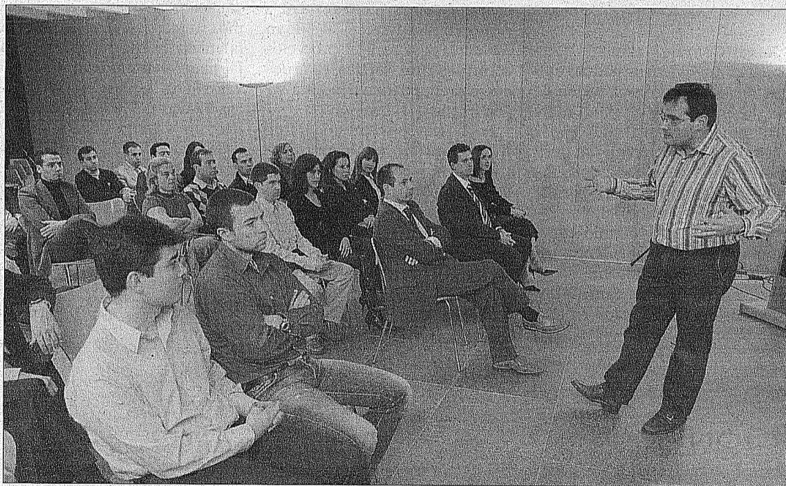
Miembros de la Asociación de Jóvenes Empresarios de Castellón, en una jornada de trabajo.

Bajo el lema De emprendedor a líder , en esta primera edición del Congreso de Jóvenes Empresarios